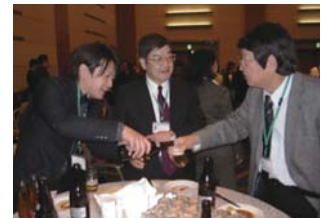
意見交換会の風景