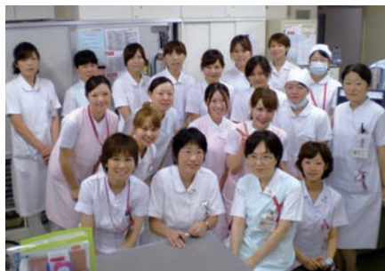
呼吸器内科病棟スタッフ

ところで、死亡原因の1位はがんであることを前述しましたが、部位別に見ると実は肺がんが1位であり、ここでも肺の病気が多いことがわかります。肺がんの治療は、癌細胞の種類、進行度、患者さんの体力によっても異なり、手術、抗