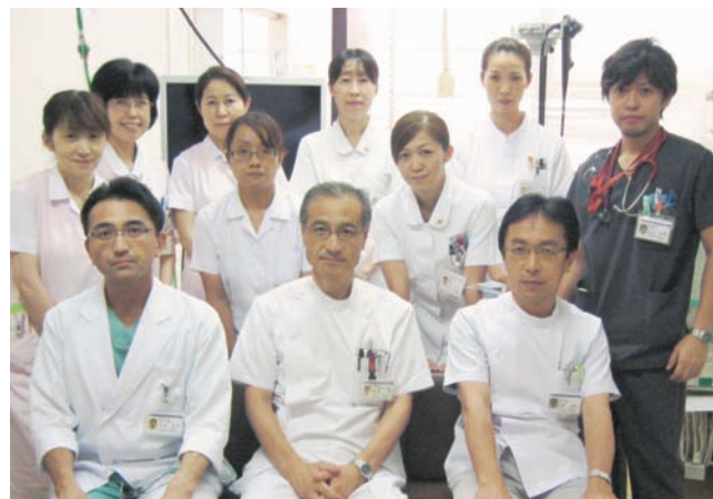
消化器内科スタッフ