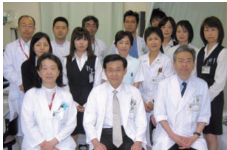
整形外科スタッフ

当院の整形外科が診療を担当している体の部位は、下肢（いわゆる「あし」）の股関節・膝関節・足部と、上肢（いわゆる腕）の肩関節で、新生児から高齢者まで、様々な病気やけがに専門的に対応しています。4年前までは股関節と足部、小児だけでしたが、地域の内科や整形外科の先生方の要望もあり、膝と肩の専門医を増員しました。これにより下肢は全体を総合的に診療することが可能になり、高度な対応ができるようになりました。しかし、全手術件数が500件から750件と1.5倍になり、人手不足が表面化しております。手術内容は人工関節（再）置換術や、人工骨頭置換術、各種関節温存手術、関節鏡視下手術、骨折接合手術、膝の靭帯再建手術、肩の腱板再建術が主なところですが、麻酔科の協力により小児の緊急を要する手術にも対応できる数少ない施設となっています。また、各部位の病気やけがへの対応だけでなく、地域の皆様の骨、軟骨、筋肉、神経、血管など運動器を構成する組織についての全身的な健康維持にも力を入れていく予定です。まず4月から当院に通っておられる患者さん