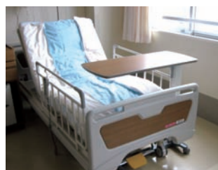
成人用電動ベッド